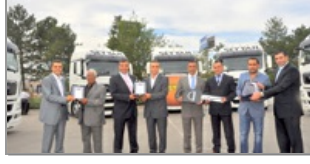
Mapar'dan Seyyah Grup'a 41 yeni yardımcı